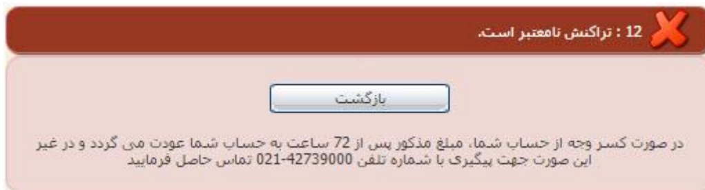
تصویر ۹-نمایش اخطار تراکنش ناموفق

با دریافت پیامک یا ایمیل جهت مراجعه به پورتال، برای مشاهده وضعیت خود اقدام نمایید. از طریق پورتال سازمان امور