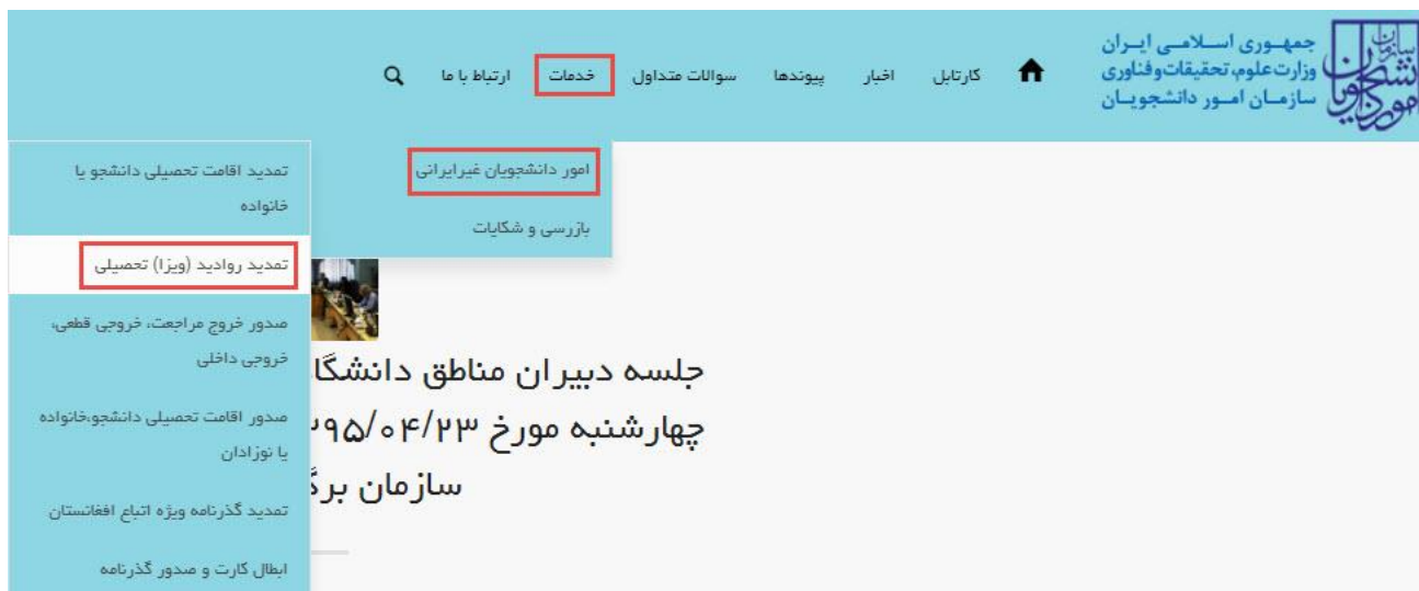
تصویر ۱-نمایش پورتال

از طریق پورتال سازمان امور دانشجویان و از سربرگ خدمات، بخش امور دانشجویان غیر ایرانی را انتخاب کرده و سپس در این قسمت جهت ثبت درخواست بر روی تمدید روادید (ویزا) تحصیلی کلیک نمایید. (تصویر ۱)