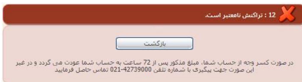
تصویر ۹-نمایش اخطار تراکنش ناموفق

با دریافت پیامک یا ایمیل جهت مراجعه به پورتال، برای مشاهده وضعیت خود اقدام نمایید. از طریق پورتال سازمان امور