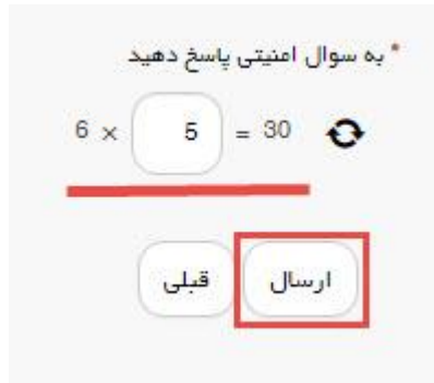
تصویر ۴- سوال امنیتی

در صورت خالی بودن فیلد های اجباری با پیغامی در بالای صفحه مواجه می شوید که در این حالت سیستم از ثبت درخواست جلوگیری می کند. (تصویر ۵)