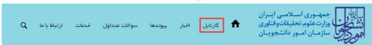
تصویر ۱۰- کارتابل شخصی

با دریافت پیامک یا ایمیل جهت مراجعه به پورتال، برای مشاهده وضعیت خود اقدام نمایید. از طریق پورتال سازمان امور دانشجویان سربرگ کارتابل را انتخاب نمایید. (تصویر ۱۰)