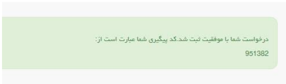
تصویر ۸- نمایش کد پیگیری

در صورت ناموفق بودن تراکنش سیستم پیغام زیر را نمایش داده و امکان رفع مشکل و سعی مجدد را برایتان فراهم می نماید. (تصویر