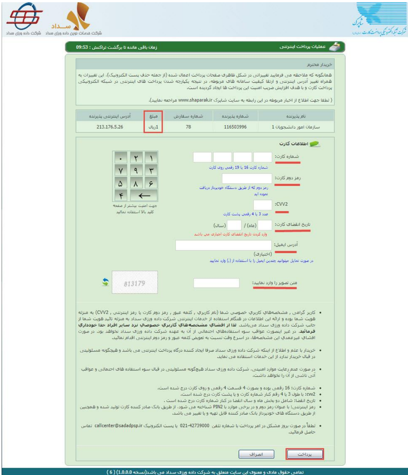
تصویر ۷-درگاه پرداخت الکترونیکی

پس از ارسال، در صورت موفقیت آمیز بودن ثبت درخواست، درگاه بانکی جهت پرداخت مبلغ ذکر شده به شما نمایش داده می شود که می بایست اطلاعات کارت بانکی خود را وارد نمایید. (تصویر ۷)